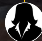
Próxima Designación Director Legal