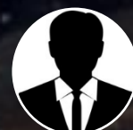
Próxima Designación Director de Contraloría